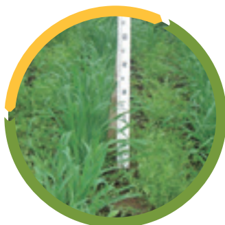
Figura 7. Avena en asocio con vicia.

Ambos cultivos se sembraron en surcos distanciados a 50 cm entre sí. Como se observa en la Figura 7, a los 45 días la cobertura de ambas especies es satisfactoria y a los 75 días alcanzaron el 100 %. La avena logró mayor altura en asocio con vicia que cuando se sembró sola. Un detalle de los resultados se presenta en el Cuadro 4.