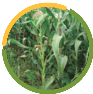
Figura 5. Maíz a cuarto mes de edad, antes de la cosecha.

Como se observa en las Figuras 4 y 5, a los cuatro meses después del establecimiento, la avena presentaba floración completa (momento de cosecha) mientras que las plantas de maíz se encontraban en estado de “cabello”, las cuales tardaron dos meses y medio más (6,5 meses) para alcanzar el momento óptimo de cosecha (grano lechoso-pastoso). Esta diferencia de edad de cosecha, aunado a la mayor producción de la avena en comparación a los híbridos de maíz, es lo que permite que la avena produzca 65 kg más de MS/ha/día que los dos mejores híbridos de maíz.