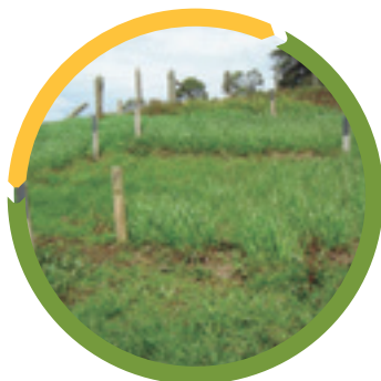
Figura 2. Ryegrass al inicio de la estación seca a 1780 msnm.

Como se observa en la Figura 2, al inicio de la estación seca, los ryegrass redujeron su potencial de producción debido a la escasez de humedad del suelo y al ataque severo de Puccinia sp. El deterioro de las pasturas fue severo, permitiendo realizar un solo corte al inicio de la estación seca y posteriormente se perdieron.