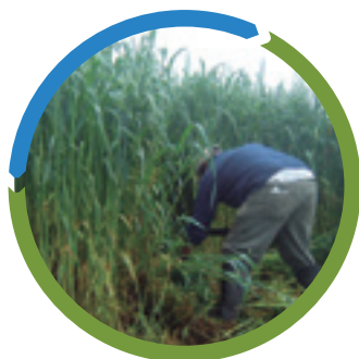
Figura 4. Avena criolla al momento de la cosecha (4 meses).

La avena presentó un 14,5 % de PC, mientras que los valores de los híbridos de maíz oscilaron entre 8 y 11,8 %.