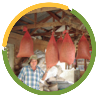
Figura 6. Almacenamiento de semilla de avena forrajera.

Es importante mencionar que la semilla de avena se debe almacenar en un lugar fresco, libre de humedad y del alcance de los roedores (Figura 6). Además, se recomienda no almacenar la semilla por más de dos años debido a que con el tiempo su potencial de germinación se reduce.