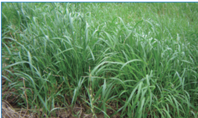
Figura 1. Ryegrass tetralite a 30 días de crecimiento

Con base a observaciones en la zona, se encontró que a partir de los 2250 msnm predominan los pastos kikuyo y tetralite, con la diferencia que el primero se adapta bien en condiciones de ladera pero no soporta la escarcha; mientras que el tetralite no se adapta a pendientes mayores al 30 %, pero soporta la escarcha que se presenta entre febrero y abril en la zona alta de nuestro país.